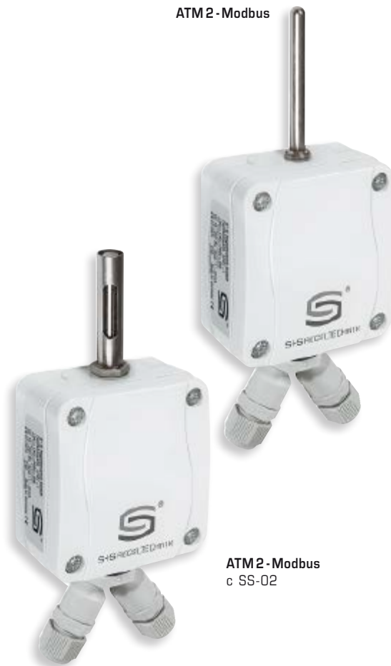
ATM 2 - Modbus с SS-02