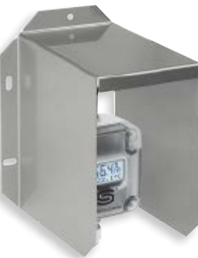
WS-04 Приспособление для защиты от непогоды и солнечных лучей (опция)